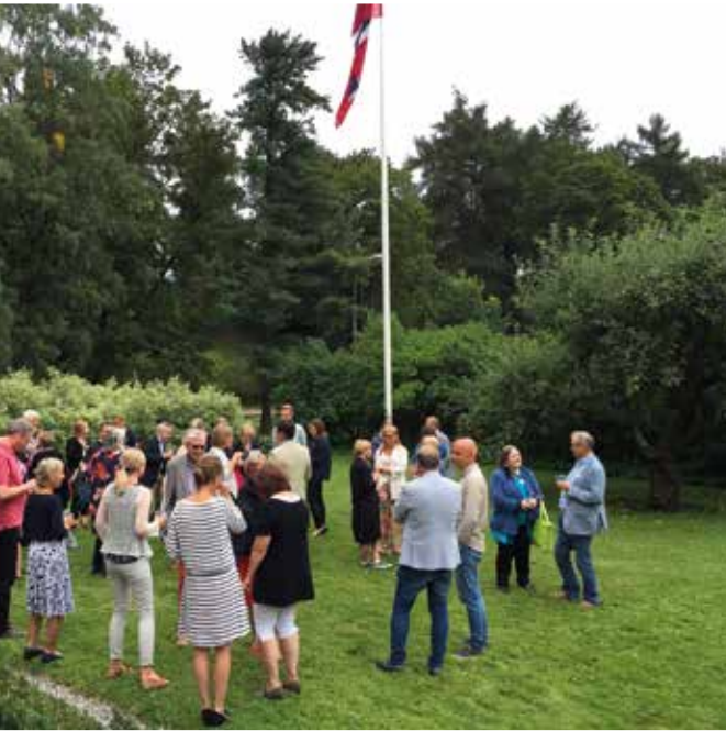
Mingling og mat i IKO-hagen.