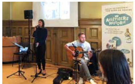
Temaet jul fikk fokus på IKO-Forlagets sommerfest 2016.